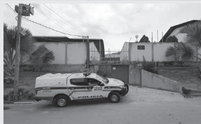
A diretora foi agredida com um soco na face, causando um corte na testa, um hematoma próximo ao olho esquerdo, e um corte no nariz

saram suas versões sobre o ocorrido aos militares. Uma equipe do Samu esteve no local e prestou o atendimento à diretora vítima de lesão corporal, os militares fizeram diligências e conseguiram localizar e apreender o menor agressor, que durante a abordagem, tentou fugir, teve que ser algemado e colocado na viatura.