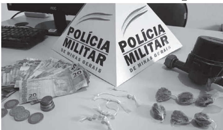
medidas de polícia judiciária. (Informações/Foto: assessoria de comunicação/ 24ª Cia PM Ind/Nanuque).

A equipe fez buscas no local, e encontraram 14 pedras e 06 buchas de substâncias análogas ao crack e à maconha, e R$116 em dinheiro. Uma mulher que estava no imóvel foi presa e encaminhada à delegacia de Polícia Civil com o material apreendido para as