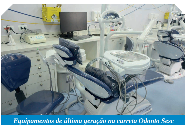
Equipamentos de última geração na carreta Odonto Sesc