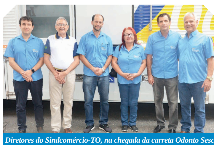
Diretores do Sindcomércio-TO, na chegada da carreta Odonto Sesc