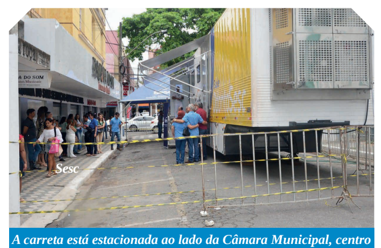
A carreta está estacionada ao lado da Câmara Municipal, centro