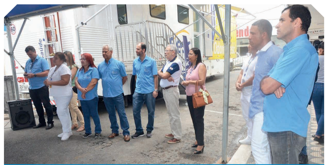
Solenidade de chegada da carreta Odonto Sesc em Teófilo Otoni, na terça-feira (04/10)

mente vai ser utilizado para a construção da unidade do Senac, e, caso não haja possibilidade de ser usada a sede do Sesc que está em comodato, pretende construir uma unidade do Sesc também junto com o Senac. Iesser adiantou à nossa reportagem que está trazendo a Agrivales, o Projeto Minas ao Luar, no dia 25 de novembro, no Expominas. E terá ainda uma Rua de Lazer, e a Co-