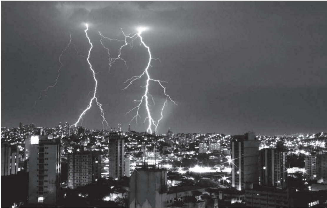
A Cemig alerta para os cuidados em dias de tempestades, especialmente em relação aos raios, que são grandes causadores de acidentes e prejuízos

Chuvas têm causado diversas ocorrências no sistema elétrico nos últimos dias e é preciso dobrar a atenção em relação aos riscos deste período