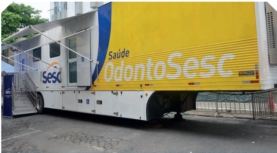
A carreta Odonto Sesc chegou em Teófilo Otoni, na terça-feira (04/10) e ficará até dezembro