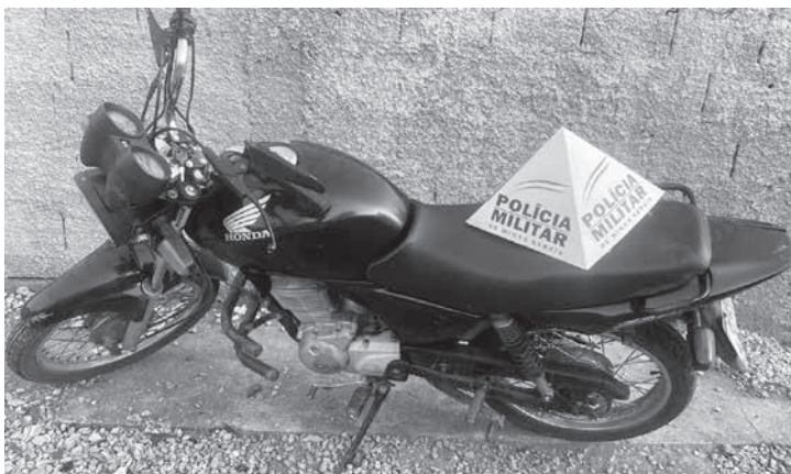
Após ser flagrado pelo filho da vítima, o homem fugiu e deixou sua motocicleta para trás

Os militares fizeram rastreamento e localizaram o homem em sua residência na zona rural de Novo Cruzeiro. Segundo a PM, ele, que apresentava sintomas de embriaguez, disse que de fato fez uso de bebida alcoólica, entrou na casa