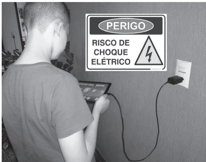
Uma das situações mais perigosas envolvendo aparelhos eletrônicos é a prática de utilizar os dispositivos conectados na tomada. Essa atitude pode causar ocorrências graves, causando incêndios e até mesmo lesões por choques elétricos e pequenas explosões, que podem ser fatais

Celulares e tablets - É preciso ter muita atenção com celulares e tablets. É importante que as crianças não utilizem os dispositivos conectados na tomada. “Amplamente utilizados hoje em dia, esses equipamentos podem causar ocorrências graves, causando incêndios e até mesmo lesões por choques elétricos e pequenas explosões, que podem ser fatais.