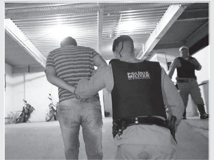
Chegada do autor na delegacia de Polícia Civil em Teófilo Otoni, no dia do crime

Assim, juntamente ao emprego de meio cruel e da prática do crime no âmbito da violência doméstica e familiar, foram adicionadas as qualificadoras de motivo torpe e uso de recurso que dificultou a defesa da vítima. Conforme a denúncia, a convívio dos pais da criança teve início em janeiro do ano passado e registrava episódios de violência doméstica praticada pelo acusado contra a mãe do bebê, inclusive, no período de gestação, com agressão física, injúria e ameaça de morte por parte do namo-