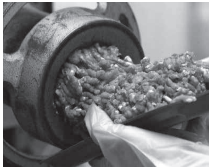
A carne moída deverá ser embalada imediatamente após a moagem, devendo cada pacote do produto ter peso máximo de 1 quilo

Novas regras - A carne moída deverá ser embalada imediatamente após a moagem, devendo cada pacote do produto ter peso máximo de 1 quilo. Não é permitida a obtenção de carne moída a