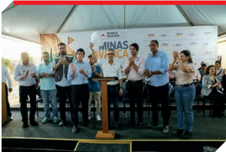
Governador Romeu Zema, deputados e secretários de Estado comemoram a retomada das obras do hospital

“Mas eu estou aqui muito feliz com a consciência do dever cumprido, de que de fato prometemos e estou tendo a oportunidade de fazer a entrega e uma demonstração para a população de que precisamos acreditar em projetos mais ousados, projetos a médio e longo prazos, que esses projetos que vão de fato elevar o nome de Teófilo Otoni e região, e fazer com que podemos dar um salto de qualidade, de desenvolvimento, é isso que nossa população precisa e merece”, pontuou. (Fotos: Diário Tribuna e Agência Minas/ Gil Leonardi/ Imprensa MG). ■