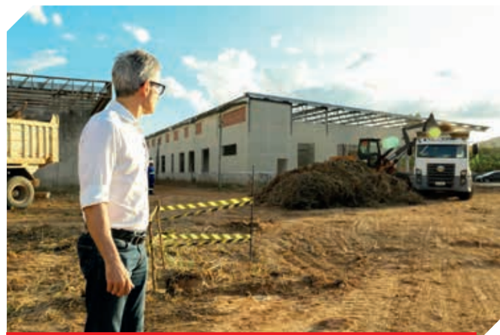
São mais de 400 leitos, 55 leitos de UTI, 8 salas de cirurgias, a maior obra da história desta região