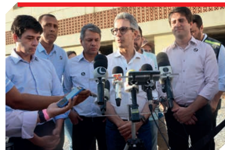
“Não é somente porque a eleição passou, que os planos mudam”, disse o governador Romeu Zema