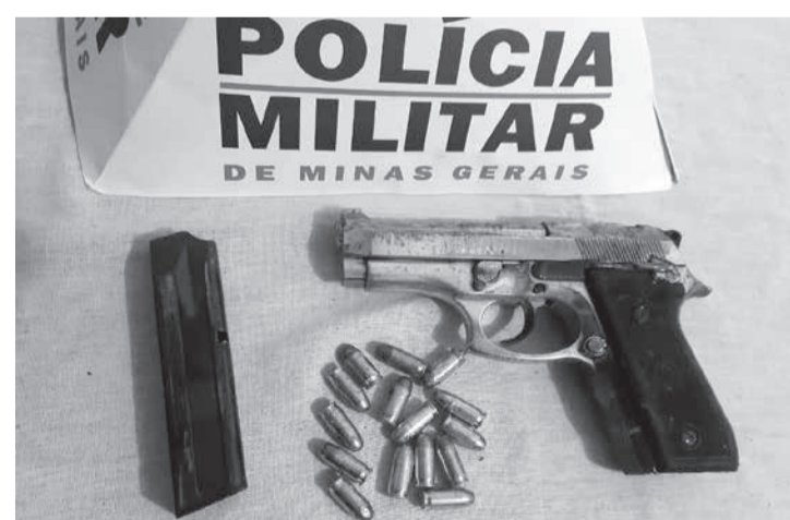
Arma de fogo e munições que estavam com os suspeitos foram apreendidas no local do acidente

Os ocupantes da moto continuaram em fuga, mas instantes depois se envolveram num acidente na MG 105, saída para Joáima, colidiram a moto de frente com um caminhão e morreram no local. O motorista do caminhão disse que o condutor da motocicleta transitava pela MG 105, fez uma manobra andando apenas com a roda traseira, o chamado “grau”, e ao tocar o chão com a roda dianteira, perdeu o equilíbrio e bateu frontal-