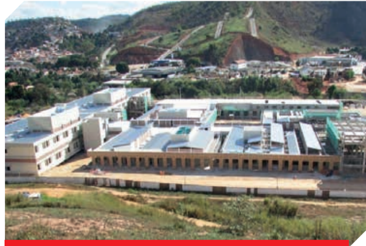
Segundo o governador de Minas Gerais Romeu Zema a previsão para a conclusão das obras do hospital é de 2 anos