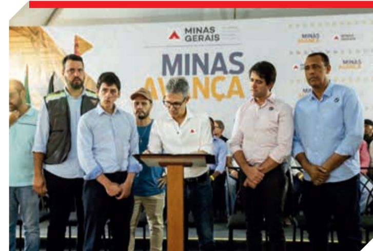
Romeu Zema assinou a ordem de serviço para reinício das obras do Hospital Regional de Teófilo Otoni