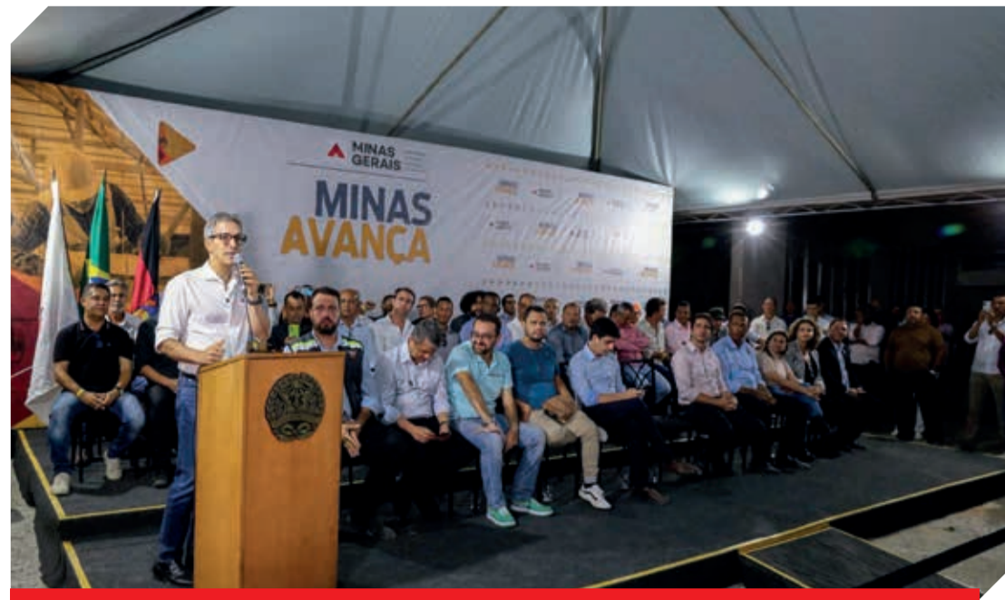
O governador informou que esse será o segundo maior hospital SUS do estado de Minas Gerais