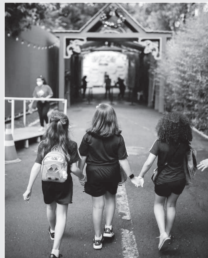
A exemplo do ano passado, mais uma vez a Cemig lança edital para selecionar iniciativas que farão parte das ações propostas no “Natal Cultural Cemig 2022”, uma das atividades previstas no calendário comemorativo de aniversário de 70 anos da companhia

Inscrições - Poderão ser proponentes neste edital de chamamento público apenas empreendedores pessoa física e/ou jurídica, com ou sem fins lucrativos, cujos projetos já tenham sido aprovados na Lei Esta-