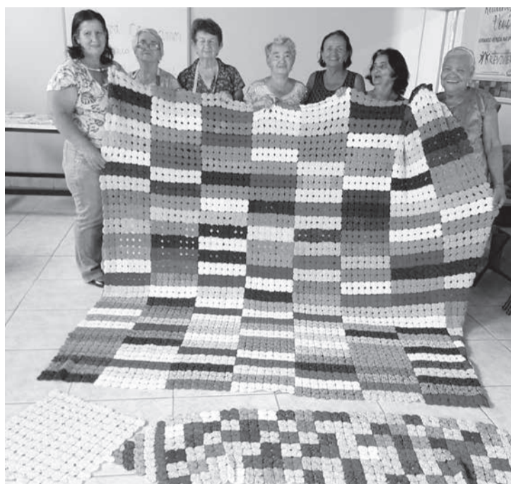
Uma das iniciativas apoiadas pela Cemig por meio do edital de 2021 foi o projeto “Retalhos da Vovó: Gerando Renda na 3ª Idade”, da Associação Clube da Melhor Idade Reviver de Porteirinha, no Norte de Minas. O projeto beneficia idosos contribuindo para a melhoria da qualidade de vida e o bem-estar emocional e social dos envolvidos

no site da Cemig, no endereço https://www.cemig.com.br/chamada-publica/01-2022-patrocinio-lei-federal-e-estadual-de-incentivo-ao-esporte/ . Dúvidas sobre o edital e/ou formulário de inscrição podem ser enviadas para o e-mail: esporte@cemig.com.br