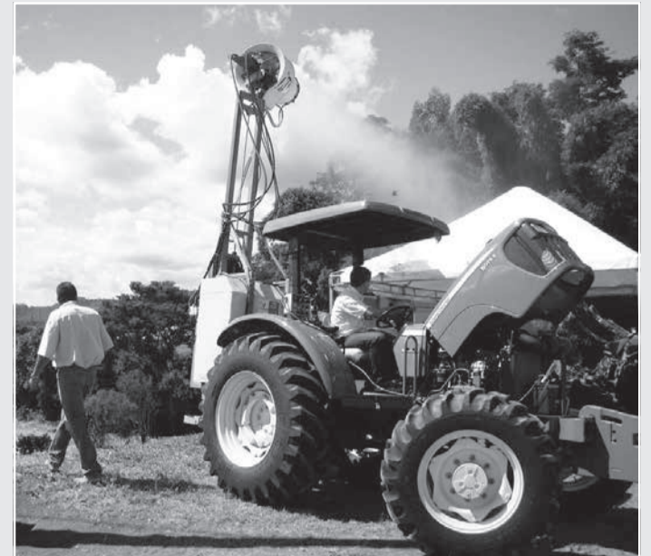
Agricultores devem ficar atentos para evitar acidentes com a rede elétrica durante a operação de máquinas agrícolas

Instalações internas - Além da preocupação com a rede elétrica da Cemig, é importante que as instalações elétricas internas dos estabelecimentos rurais estejam em perfeitas condições