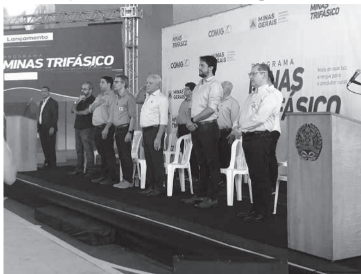
Entre os programas em execução pela Cemig, que estão aumentando a qualidade e oferta de energia em todo o estado, destacam-se o Mais Energia (foto 2) e o Minas Trifásico (foto 1), que estão entregando, respectivamente, mais 200 subestações de energia espalhadas em MG e novos 30 mil km de rede elétrica com maior capacidade de atendimento nas áreas rurais

“Estamos muito felizes com essa medalha, com essa homenagem. É o reconhecimento do trabalho de toda a empresa que voltou seu foco, seu olhar, novamente, para