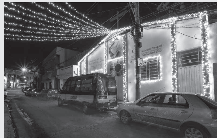
Enfeites em áreas externas merecem atenção especial devido à exposição a elementos naturais como vento e chuva, além da distância de segurança em relação à rede elétrica

Além disso, João José resalta que as pessoas devem dar preferência a enfeites luminosos com lâmpadas de led. “As lâmpadas de led vão proporcionar um consumo menor e mais consciente de energia elétrica. Além disso, eles são mais duráveis e podem ser utili-