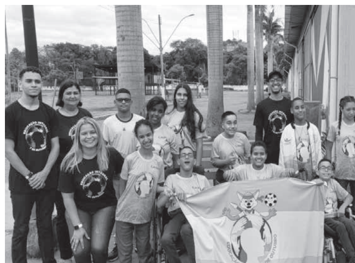
Delegação de atletismo representa Minas Gerais na competição que acontece até sábado, em São Paulo

Ipatinguenses nas Paralimpíadas Escolares - Após uma participação destacada na fase regional das Paralimpíadas Escolares, realizada em agosto, na capital federal, a delegação ipatinguense representada pela equipe do Projeto Paralímpico do Centro Esportivo e Cultural 7 de Outubro, embarcou na segunda-feira para São Paulo, onde acontece a fase nacional da competição, que irá até o dia 26 de novembro, sábado. Os dez alunos que obtiveram índice para a fase final e representarão Ipatinga em Minas Gerais em uma competição de nível nacional participarão das provas de atletismo, que incluem corridas, saltos e lançamentos. (Portal da Cidade – Ipatinga)