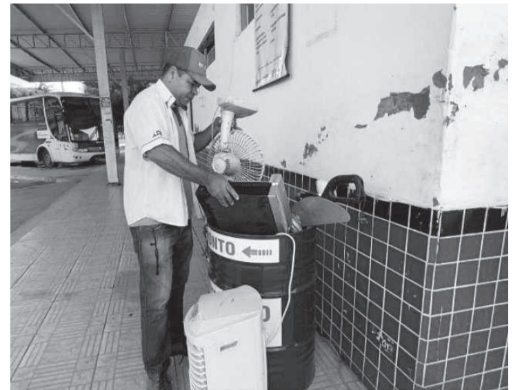
62 municípios do Norte de Minas vão receber pontos para recolhimento de resíduos eletroeletrônicos

Prefeitura libera trecho de avenida - A Prefeitura de Araguari, com o apoio da Polícia Militar, realizou uma operação para demolir um muro na Avenida das Codornas, que impe-