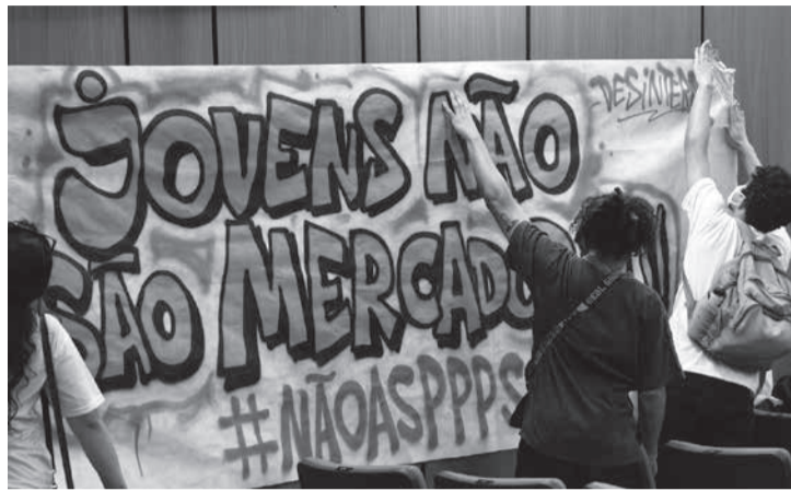
Críticos da proposta pedem a suspensão do processo que julgam racista e classista

Modelo prevê dois centros e 180 novas vagas - O Novo Socioeducativo, como é chamado o modelo de PPP para o setor, é resultado de parceria do Governo do Estado com o Governo Federal e o Escritório das