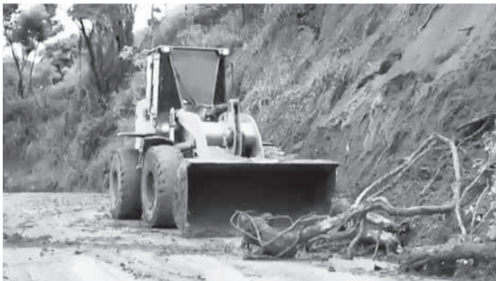
Prefeitura cria plano operacional de enfrentamento aos incidentes causados pela chuva em Teófilo Otoni

O baixo estoque no Hemocentro Regional de Governador Valadares acende um alerta. Por isso, a instituição está convocando doadores. Com cada doação é possível beneficiar até quatro pessoas. O estoque está baixo, e com as festas de final de ano, incluindo a Copa do Mundo, há uma redução significativa no número de doações. Segundo informações do Hemocentro, a grande quantidade de atendimentos na região demanda muitas bolsas de sangue. O Hemocentro de Valadares é responsável por atender, além do consumo local, mais de 50 hospitais das regiões do Vale do Rio Doce, Vale do Aço, Vale do Mucuri e Vale do Jequitinhonha. (Diário do Rio Doce – Governador Valadares)