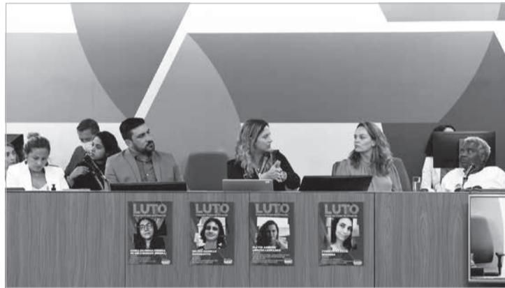
Novo Socioeducativo foi apresentado nesta terça (29) em audiência marcada por críticas ao modelo

Nações Unidas de Serviços para Projetos (Unosps) e foi apresentado na reunião por representantes do Executivo Estadual e do escritório.