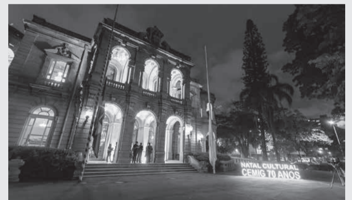
A tradicional iluminação da Praça da Liberdade, em Belo Horizonte, é um dos projetos patrocinados pela Cemig. Além da Capital, outras 15 cidades também vão receber projetos patrocinados pela companhia, todos via leis de incentivo

gria para as festas de fim de ano dos mineiros em várias regiões. A relação completa com todas as atrações do Natal Cultural Cemig 2022 está disponível no endereço eletrônico https://www.cemig.com.br/natalculturalcemig .