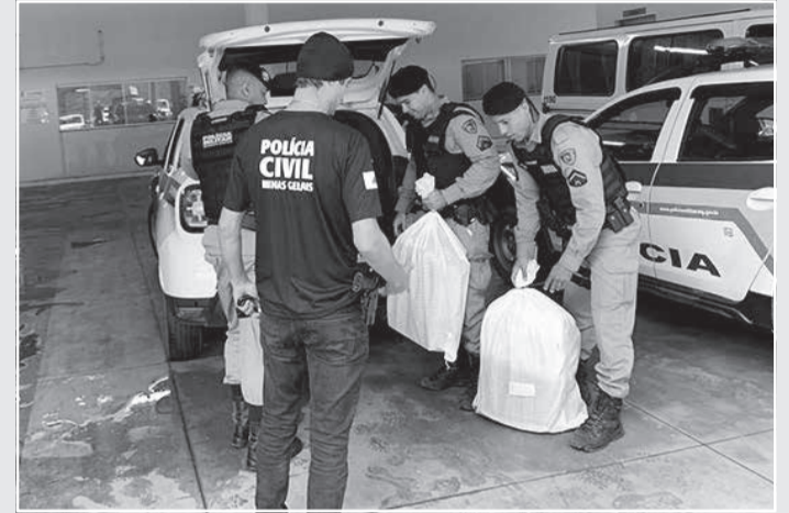
Foram cumpridos 15 mandados de busca e apreensão expedidos pelo juízo da segunda vara de Guanhães

Segundo as investigações, o grupo criminoso incluía veículos apreendidos em procedimentos criminais em leilões sem a devida autorização do juízo criminal competente, frustrando a reparação do dano ou até mesmo restituição do bem ao legítimo proprietário. Também clandestinamente, peças eram retiradas dos veículos apreendidos, seja para serem revendidas a terceiros ou até mesmo para tornar os veículos menos atrativos quan-