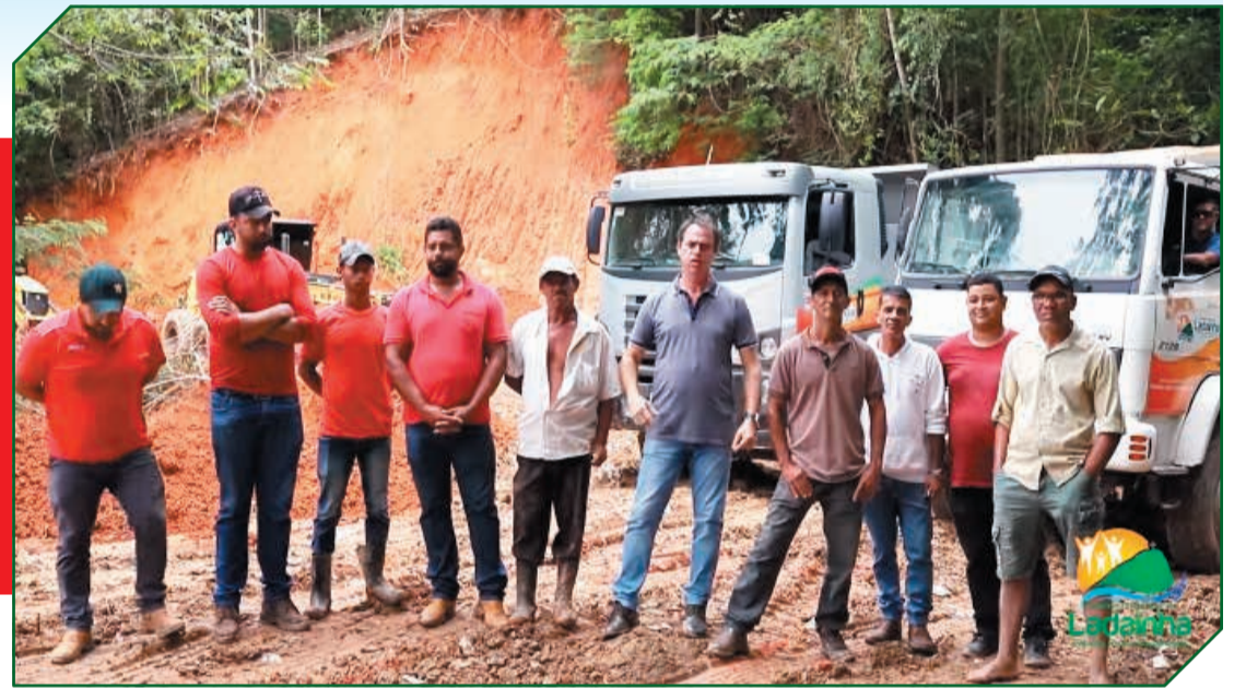
A Prefeitura e Defesa Civil Municipal estão atuando para que o impacto seja o menor possível

O município de Ladainha é composto por 70% de zona rural, e, nesse período de fortes e constantes chuvas que tem caído, a Prefeitura e a Defesa Civil Municipal vem atuando efetivamente e ininterruptamente para garantir que a população não seja atingida pelos danos causados pelo grande volume de águas. Estão atuando para que o impacto seja o menor possível. O trabalho não é somente nos momentos de vulnerabilidade. É justamente a prevenção que promove o melhor resultado, e é isso que está sendo feito.