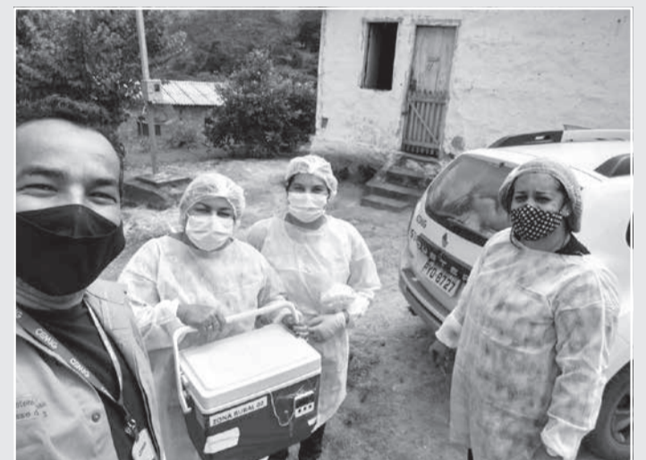
A empresa recebeu o reconhecimento da Associação Brasileira de Recursos Humanos - Seccional Minas Gerais (ABRH/MG) em algumas cidades.

Além da categoria ESG, a Cemig também foi destaque na modalidade Comunicação Interna com o projeto Cultura e Estratégia: um verdadeiro gol de placa. Sobre o reconhecimento, Bruno parabenizou o trabalho da equipe e falou sobre a atuação da área para o alcance dos direcionamentos estratégicos. “Temos uma comunicação interna que preza pela transparência, agilidade e, principalmente, pela forma mais humana e próxima das pessoas, trabalhando com foco no diálogo e no fortalecimento da liderança como principal canal com os colaboradores”, finalizou.