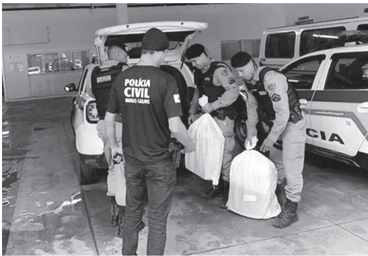
Quinze mandados de busca e apreensão foram cumpridos durante a operação

População pode sugerir medicamentos - A Comissão Especial de Farmacologia e Terapêutica (CEFT) da Secretaria Municipal de Saúde de Sete Lagoas está realizando um amplo trabalho de reavaliação da Relação Municipal de Medicamentos Essenciais, cuja última atualização ocorreu no ano de 2015. A revisão da relação de medicamentos tem como objetivo ajustar a lista de medicamentos de acor-