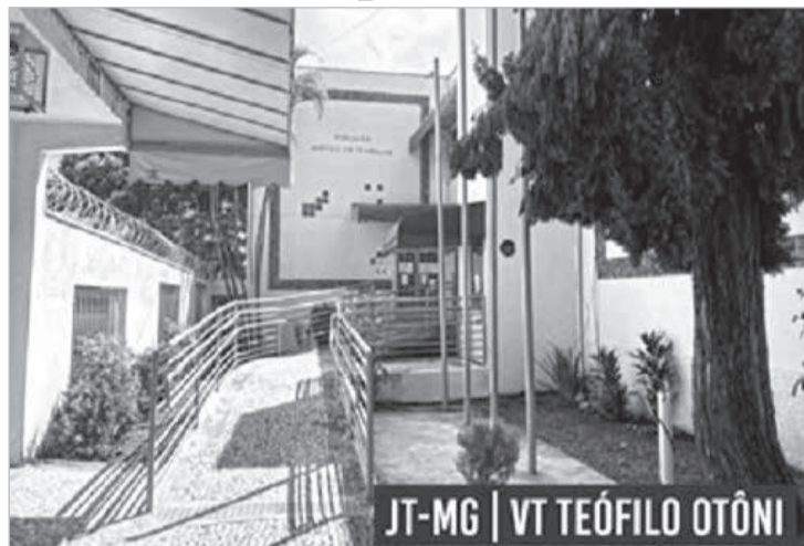
JT-MG | VT TEÓFILO OTONI

Ficou provado que, de fato, o trabalhador foi obrigado a se afastar do local da prestação de serviços em razão da medida protetiva imposta em processo criminal. Inclusive, evidenciou-se que, posteriormente, houve redução da distância mínima que teria que ser observada pelo trabalhador em decorrência da medida protetiva. Entretanto, conforme pontuou a julgadora, a empresa não deu causa a esses acontecimentos e não cometeu qualquer ilícito, não podendo ser responsabilizada