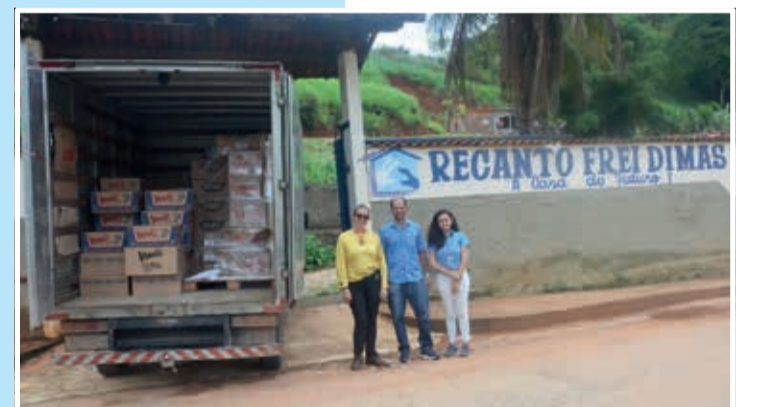
Entrega de donativos na instituição de idosos Recanto Frei Dimas