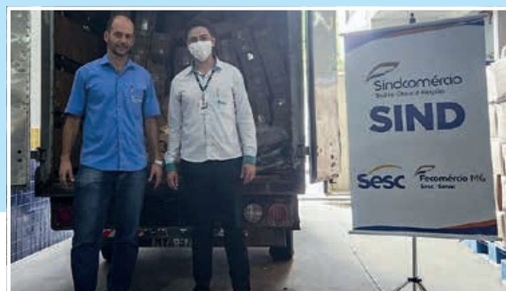
Doações entregues na Associação Hospitalar Santa Rosália