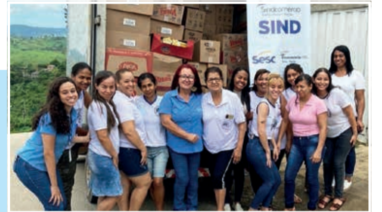
Entrega de alimentos na creche Cantinho da Solidariedade