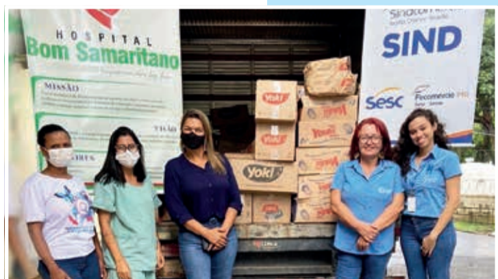
Doações entregues na Associação Hospitalar Bom Samaritano