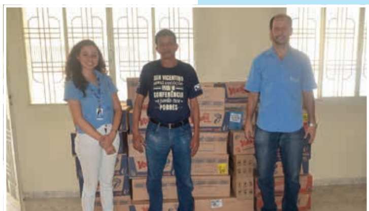
Entrega dos alimentos na Sociedade São Vicente de Paulo