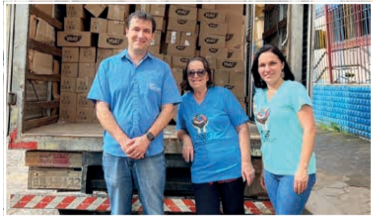
O Ninho - Centro de acolhimento e defesa da criança e adolescente

Ainda na quarta-feira (21), foram entregues alimentos ao Hospital Santa Rosália , instituição fundada em 12/08/1896, um dos mais antigos hospitais de Minas Gerais. Referência para aproximadamente um milhão de pessoas da Macrorregião Nordeste. Nesta data, também foram entregues alimentos no Bom Samaritano, unidade hospitalar de média e alta complexidade, de caráter público, com atendimento 100% SUS, que presta serviços de saúde a um milhão de habitantes abrangendo 63 municípios.