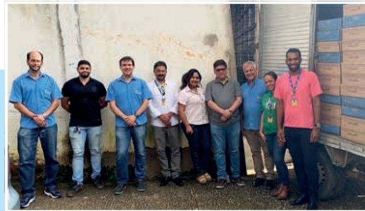
Entrega na AMCA - Apoio à mulher, à criança e ao adolescente