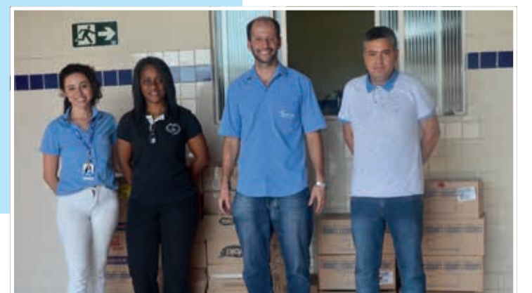
Entrega de alimentos na Legião da Boa Vontade (LBV)