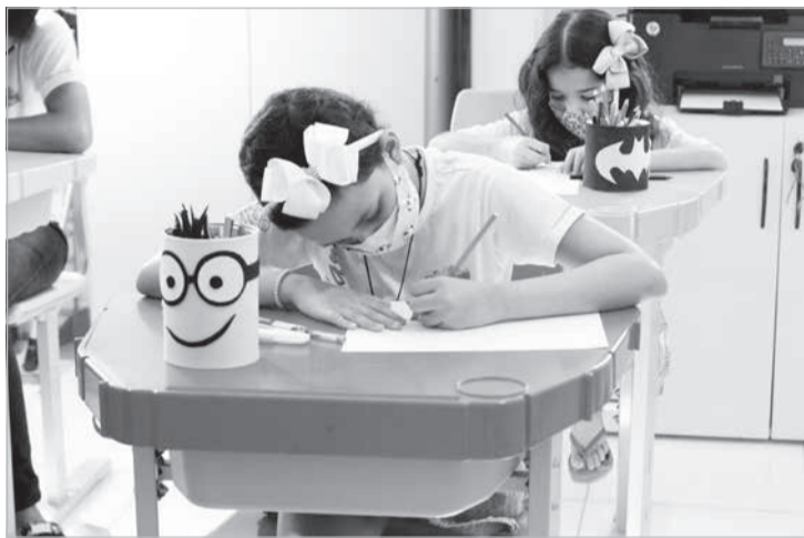
O Programa AI6% já beneficiou milhares de crianças e adolescentes desde a sua criação, há 20 anos. Em 2022, foram 145 entidades beneficiadas, que dão suporte a crianças e jovens em todo estado, com destinação de R$2,4 milhões para apoio e cuidados com esse público assistido por instituições em 77 cidades do Estado de Minas Gerais

“O AI6% incentiva empregados a participarem da ação e também faz um aporte na instituição escolhida pelo colaborador. Dessa maneira, acreditamos que a companhia se torna uma multiplicadora das destinações do imposto pelos empregados e conta com os padrinhos e madrinhas das instituições que conhecem o trabalho mais de perto, apresentam essas entidades para os colegas e ainda atuam no acompanhamento das prestações de contas que