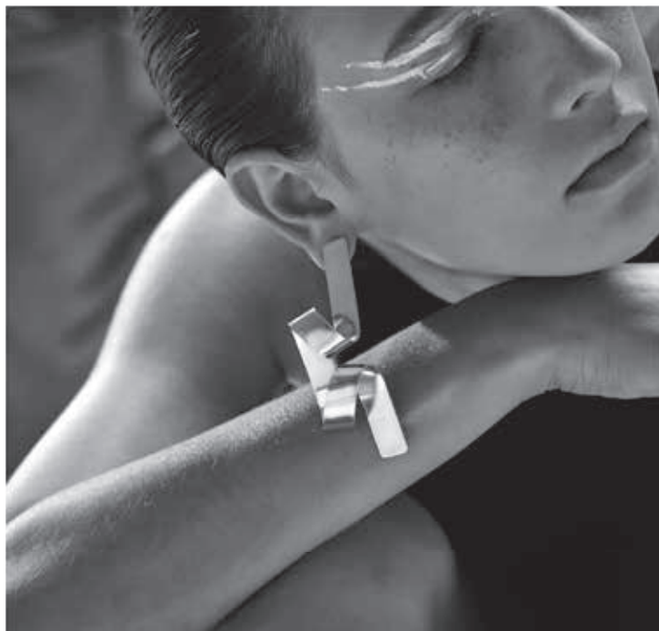
O belo design de Carlos Penna

Na evolução natural das coisas, seu traço foi se tornando mais leve e mais