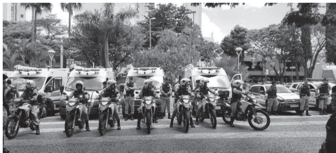
Homicídios e taxa de tentativas de homicídio caiu nos últimos anos (Igor Martins)

Número de homicídios em Uberlândia cai - O número de homicídios consumados em Uberlândia registrou uma queda de 118% na última década. De acordo com um levantamento da Secretaria de Justiça e Segurança Pública (Sejusp), a redução média anual foi de aproximadamente 11,8%, se somados os dados entre 2012 e 2022. Os índices de tentativas de assassinato também caíram em torno de 127%, considerando o mesmo período. O relatório do Observatório de Segurança Pública mostra que, após o ano de 2012, os registros de homicídios consumados vêm caindo gradativamente. Na comparação dos últimos 10 anos, as maiores quedas foram registradas entre 2017 e 2018 e de 2019 para 2020, com quedas de 40% e 46% no número de ocorrências, respectivamente. (Diário de Uberlândia)