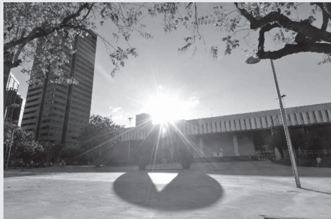
Os deputados eleitos para a 20ª Legislatura serão empossados no dia 1º de fevereiro

Solenidade também marca o início da 20ª Legislatura, um novo ciclo de quatro anos na ALMG