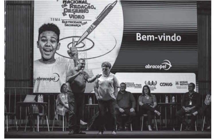
Evento realizado em Minas Gerais reforçou a parceria da Cemig com a Abracopel e registrou a abertura da 12ª edição do Concurso, que pretende mobilizar escolas de todo o Brasil

Estão abertas as inscrições para a 12ª edição do Concurso Nacional Abracopel de Redação, Desenho e Vídeo - Etapa Regional da Associação Brasileira de Conscientização para os Perigos da Eletricidade (Abracopel). A Cemig é parceira e patrocinadora deste projeto, que busca incentivar a participação de crianças, adolescentes e professores no desenvolvimento e disseminação dos conceitos de segurança no uso da eletricidade, engajando toda a co-