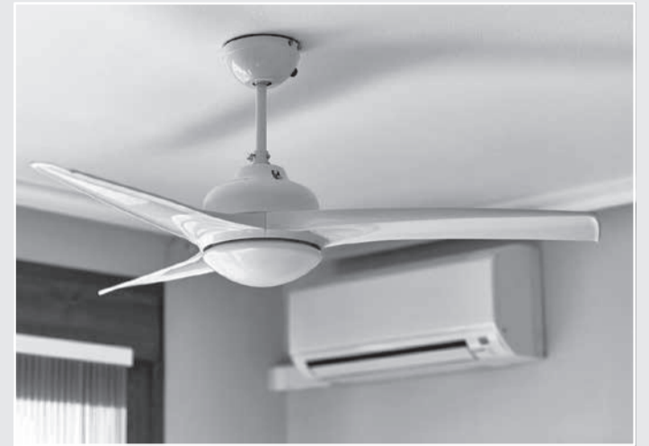
Ventilador e ar-condicionado são muito utilizados no verão

O especialista da Cemig também esclarece que o ar-condicionado tem uma potência elevada e que funciona de forma similar à geladeira, só retirando o ar quente do ambiente. Por isso,