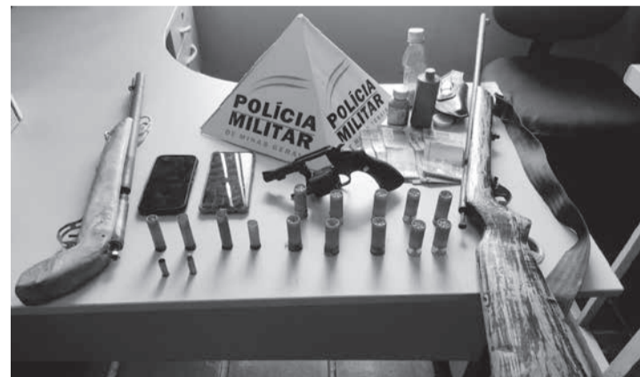
Durante diligências os militares apreenderam armas de fogo, dinheiro e munições

pingardas de fabricação artesanal; 09 cartuchos intactos e 01 picotado de calibre 12; 01 cartucho intacto calibre 28; 01 cartucho intacto e 01 deflagrado de calibre 38; dois telefones celulares; um coldre, R$ 4.500,00 em mo-