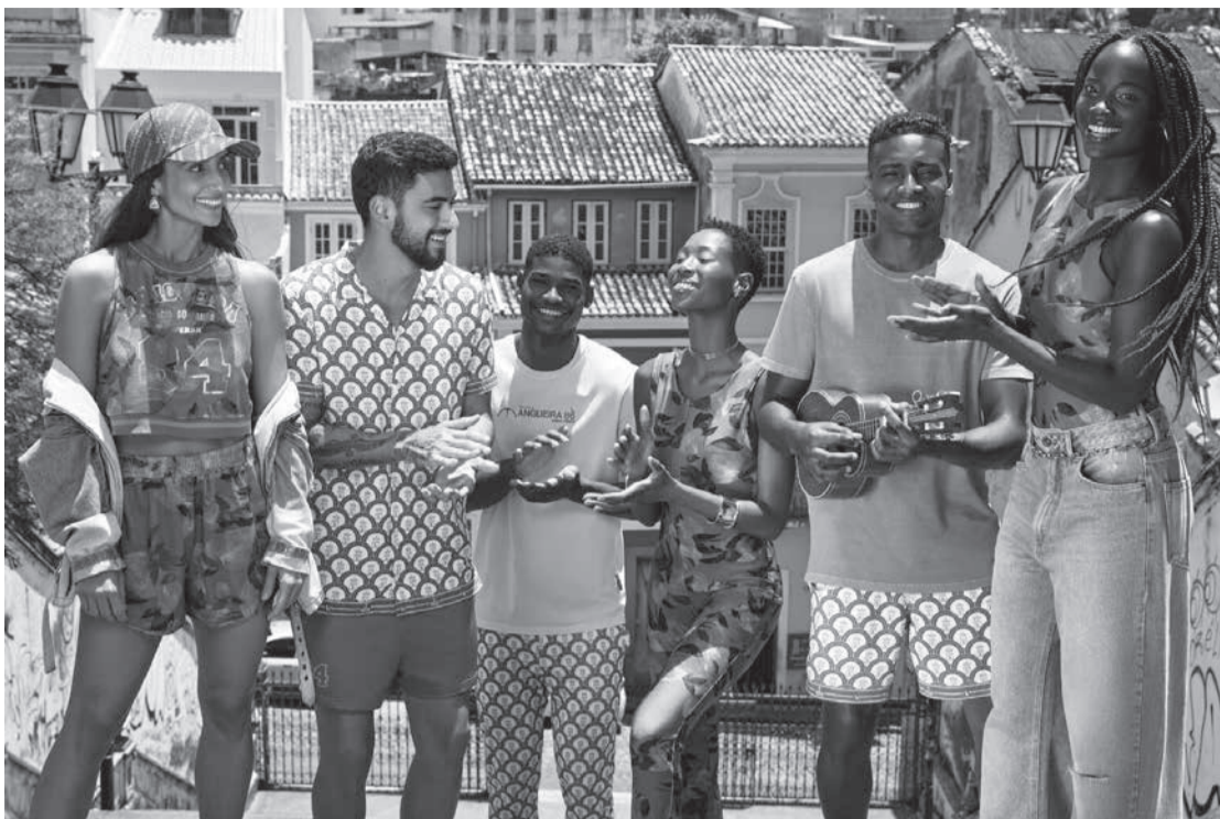
Carnaval da Reserva em versão Mangueira