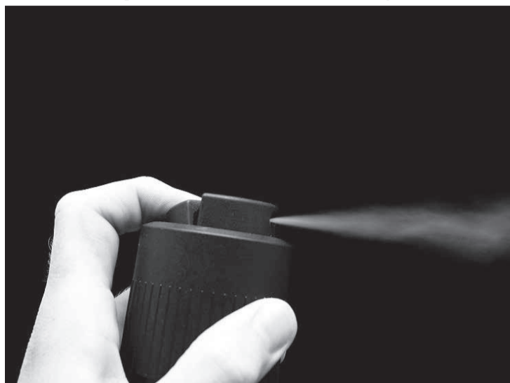
Desodorante vazou de recipiente, atingindo o rosto, braços e parte do abdômen da consumidora

Depois de rodar expelindo jatos, o frasco bateu em diversos objetos até cair no chão, e continuou a pulverizar o líquido, produzindo ruídos explosivos até o esvaziamento total de seu conteúdo. A servidora aposentada afirma que seus olhos não foram atingidos pelo fato de ela estar com óculos de grau. Contudo, o contato direto da substância poderia ter ocasionado cegueira, con-