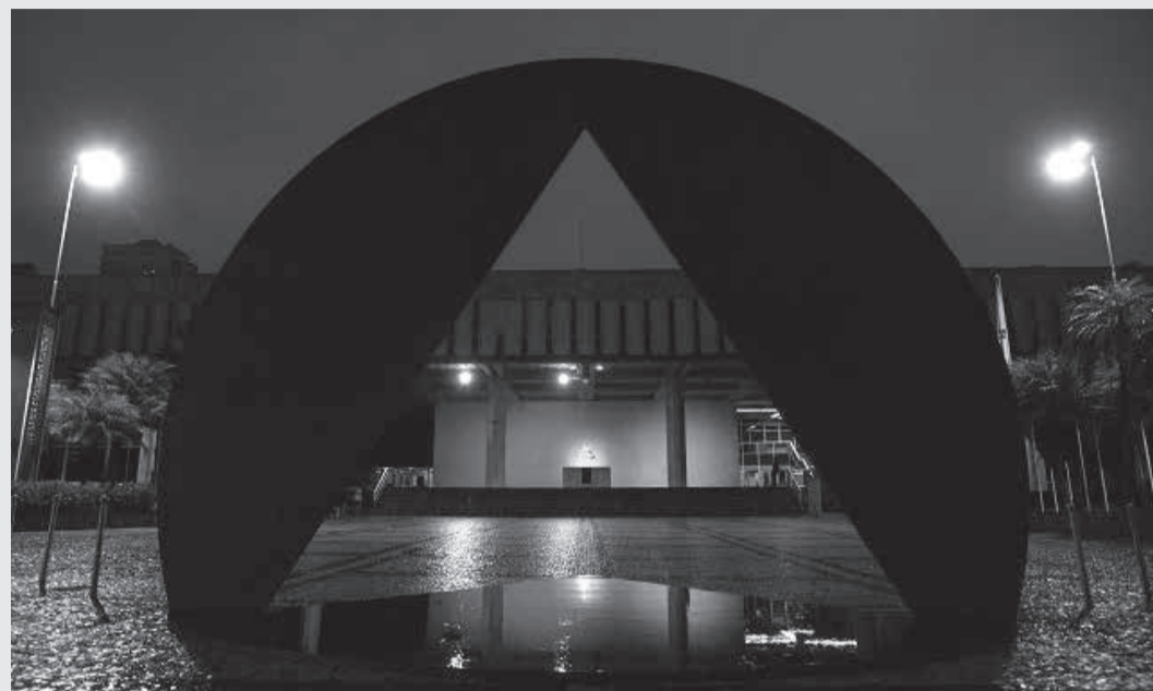
Mais uma vez a fachada do Palácio da Inconfidência recebe iluminação especial pelo Dia Mundial das Doenças Raras

Data de conscientização, celebrada mundialmente em mais de 80 países, sensibiliza o público para impacto na vida dos doentes e famílias