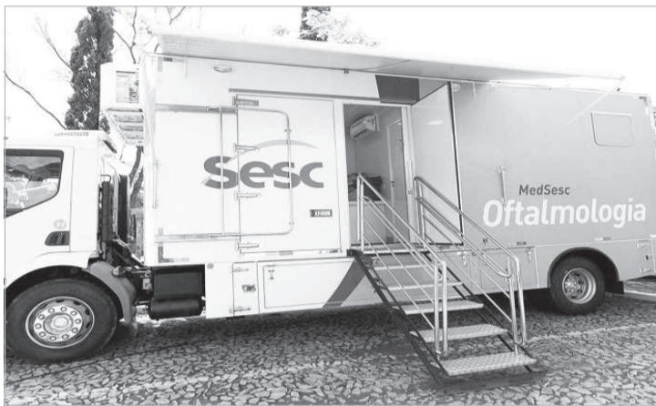
MedSesc Oftalmologia, projeto itinerante do Sesc em Minas. Em um caminhão de 11 metros, serão realizadas consultas e exames oftalmológicos