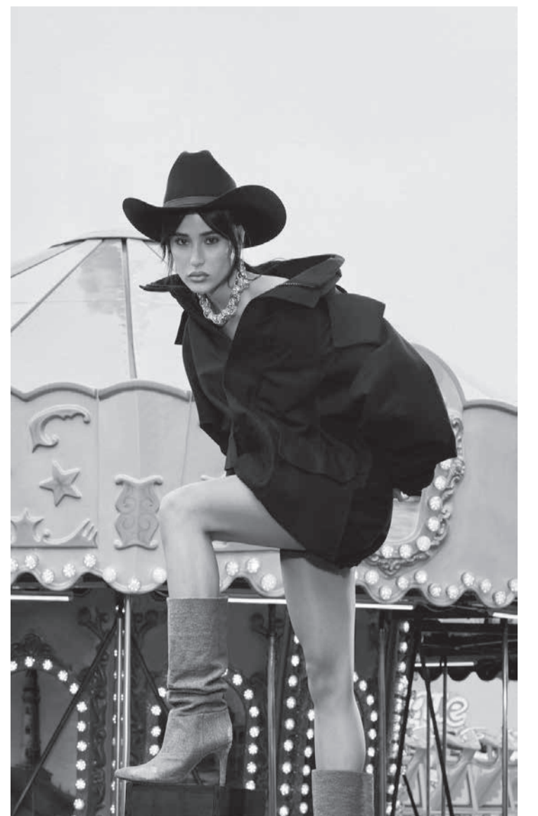
O inverno 23 da Arezzo

A compra da marca italiana (por 25 milhões de dólares) é coerente com a meta da empresa de alcançar o mercado mundial de forma mais ampla. Coincidência, isso se dará pelo país que inspirou a marca do grupo – quando o Anderson Birman (pai do Alexandre) apontou a cidade de Arezzo, no mapa, para escolher o nome da empresa iniciante. Esse ‘circuito conceitual’ para a nova aquisição se fecha, brilhantemente, ao remeter ao mercado norte-americano (foco final de tudo isso) através