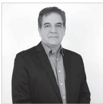
Presidente do Sistema Fecomércio, Nadim Donato

Espaço de Lazer - No Espaço de Lazer, serão promovidas diversas atividades recreativas, gratuitas, voltadas a crianças, jovens e adultos. São disponibilizados ao público brinquedos, brincadeiras, atividades lúdicas e oficina criativa. Nesta edição, o Espaço de Lazer terá cama elástica, pula-pula, pintura facial, jogos de mesa, espaço kids, música e intervenções recreativas. Há também ações com foco no resgate das brincadeiras tradicionais. Ao longo do dia, as famílias poderão curtir um espaço de lazer com apresentações culturais de artistas locais.