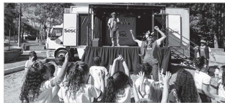
No Espaço de Lazer, serão promovidas diversas atividades recreativas, gratuitas, voltadas a crianças, jovens e adultos