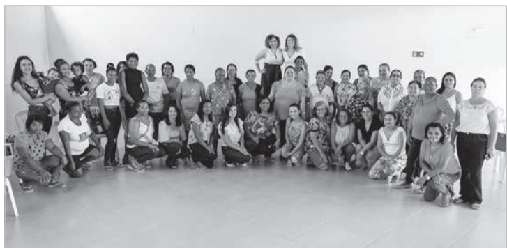
Finalização do encontro