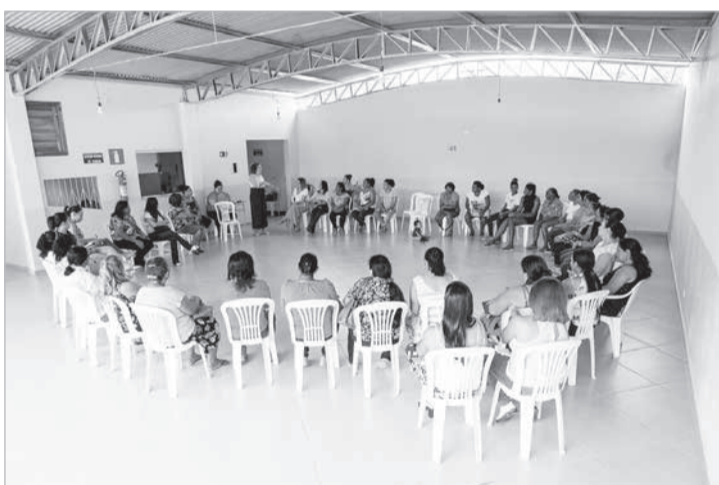
Roda de mulheres