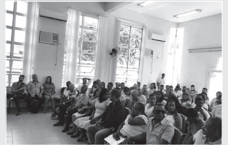
Cerimônia reuniu familiares, amigos e pessoas da comunidade

“A ideia do casamento comunitário surgiu da vontade, exteriorizada por várias pessoas de baixa renda, de concretizar o sonho de se casar ‘no papel’. Os participantes já viviam em união estável há vários anos, mas não tinham a perspectiva de oficializarem a união. Esse fato é uma realidade na nossa comunidade, localizada entre os vales do Jequitinhonha e Mucuri. Por isso, resolvemos nos mobilizar para realizar o casamento