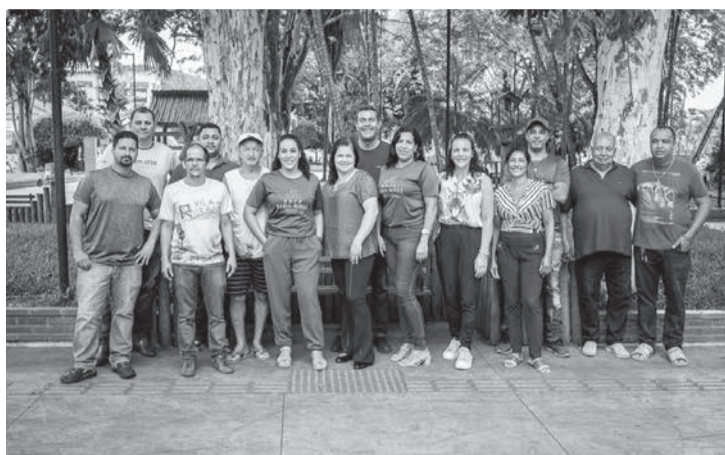
pela Secretaria Municipal de Educação, Cultura, Turismo, Esporte e Lazer e IGR Pedras Preciosas, através da Prefeitura Municipal de Ladainha. (Informações/Fotos: assessoria de comunicação da Prefeitura de Ladainha).