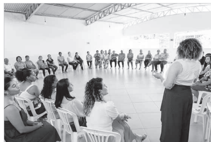
Roda de conversa ativa