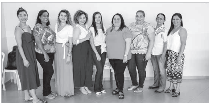
Protagonismo das mulheres