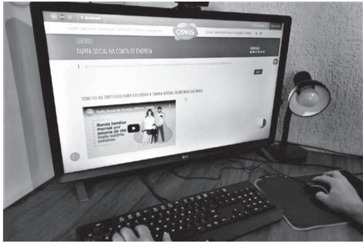
O benefício pode gerar uma redução que pode chegar a até 65% do valor da conta de luz para as famílias de baixa renda