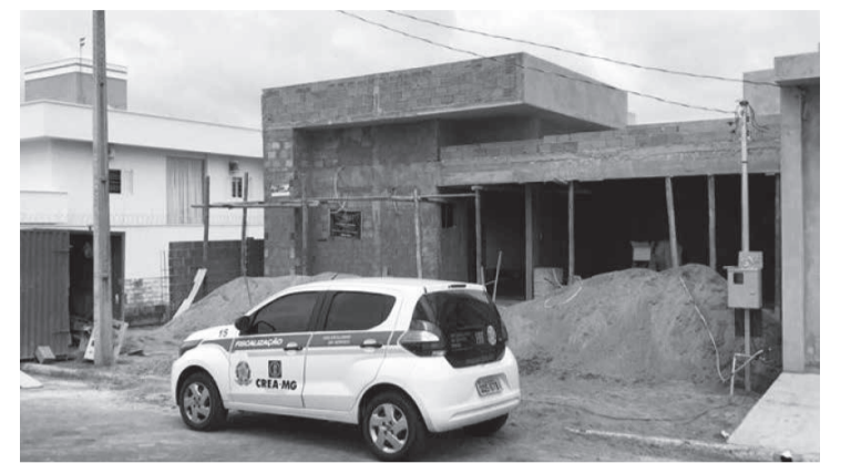
Área de fiscalização da inspetoria do Crea em Juiz de Fora abrange 34 municípios