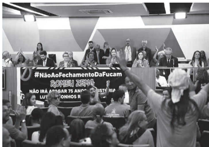
Absorção da Fucam pela Secretaria de Educação foi tema de audiência nesta quinta (23), na Comissão de Educação