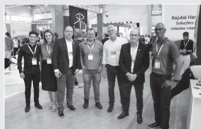
Visão geral - Sebrae Minas promove participação de empresários e prefeitos mineiros na Smart City 2023, em Curitiba

“Essa participação de gestores públicos e empresários mineiros nesse evento que aponta soluções para as cidades se