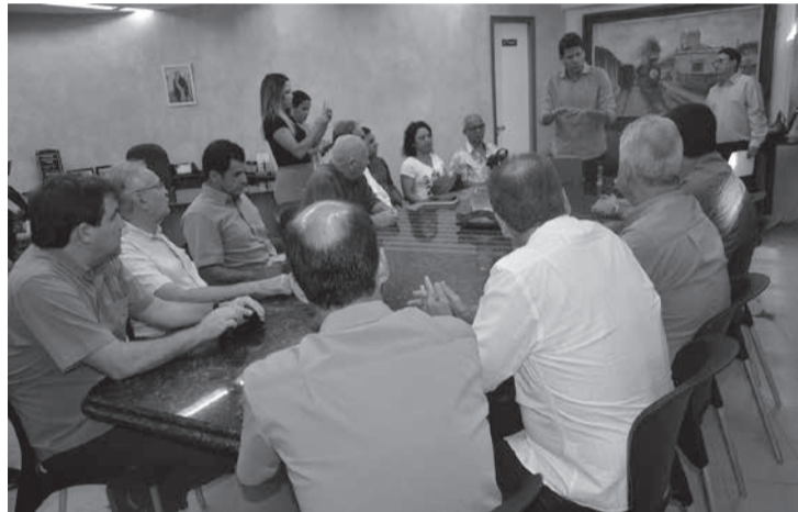
Presença de entidades de classe e demais parceiros, durante a assinatura do contrato da Prefeitura com o Sebrae