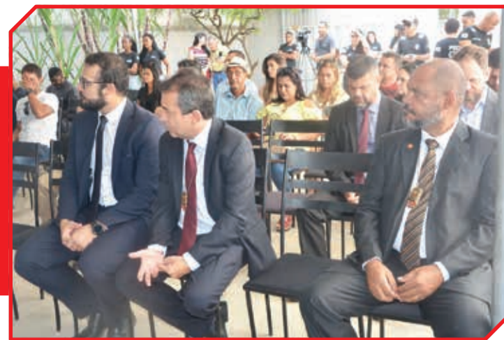
Inauguração da Ciretran em Itambacuri, na segunda-feira (27/03)