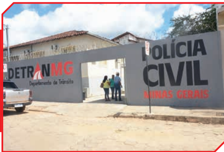
O setor funciona de segunda a sexta-feira, das 9h às 16h