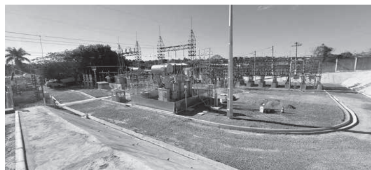
Com esses investimentos, haverá a conclusão do Mais Energia, que está ampliando em 200 o número de subestações (SEs) no estado. Dessas unidades, 64 já estão em operação (acima as SEs Serra do Salitre no Triângulo (foto 1) e Bocaiúva (Foto 2) no Norte de Minas, já em funcionamento

Entregas Mais Energia - Com esses investimentos, haverá a conclusão do Mais Energia, que está ampliando em 200 o número de subestações no estado. Dessas unidades, 64 já estão em operação. Até 2027, serão entregues mais 136 novas instalações em todas as regiões do estado, sendo 23 apenas em 2023. Ao final do Programa, a população mineira irá contar um total de 615 subestações, eliminando os gargalos e restrições, e contribuindo para a indução de desenvolvimento em todo o estado.