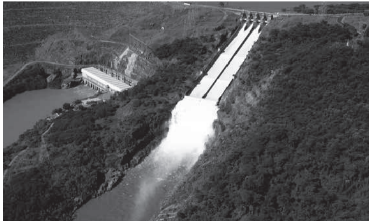
A Cemig vai investir, aproximadamente, R$ 17 bilhões em seus ativos de GT entre 2023 e 2027, aumentando a sua capacidade de geração de energia e diversificando o portfólio atual. Os reservatórios das UHEs Três Marias (foto 1), Cajuru (Foto 2) e Emborcação (Foto 3) vão receber usinas solares flutuantes até 2024

a entrada em operação dessas usinas, a Cemig SIM vai poder utilizar essa energia na geração distribuída, aumentando a oferta aos clientes desse segmento”, explicou o diretor.