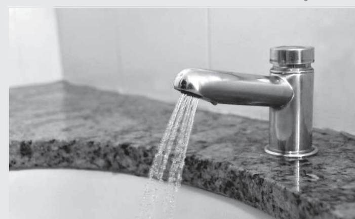
Uma das medidas propostas é para realização de campanhas publicitárias de cunho educativo sobre o consumo consciente da água

A norma sancionada acrescenta artigo à Lei 23.491, de 2019, que institui a Semana Estadual de Conscientização sobre o Uso Racional da Água. O trecho incluído ressalta que, a fim de estimular a redução do consumo de água pela população, o Estado poderá adotar certas medidas, especialmente durante a semana instituída pela lei.