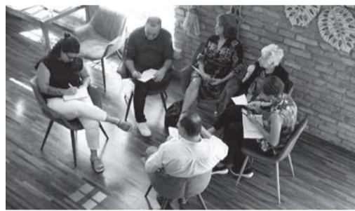
Grupo temático III

O Fórum Brasileiro de Segurança Pública é uma organização da sociedade civil, reconhecida pela excelência nos estudos sobre segurança pública e criminalidade no Brasil, e que publica o Anuário Brasileiro de Segurança Pública, referência para formulação de políticas públicas desde o nível local ao nacional. “A finalidade do encontro foi trazer as novas metas e objetivos da entidade, que se propõe a colaborar para que a segurança pública seja efetivada como um direito dos cidadãos brasileiros, por meio da produção de dados e informações que tenham impacto no debate sobre os temas relacionados à área” (@forumseguranca).