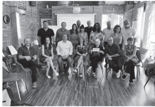
Diretores e Conselheiros do FBSP