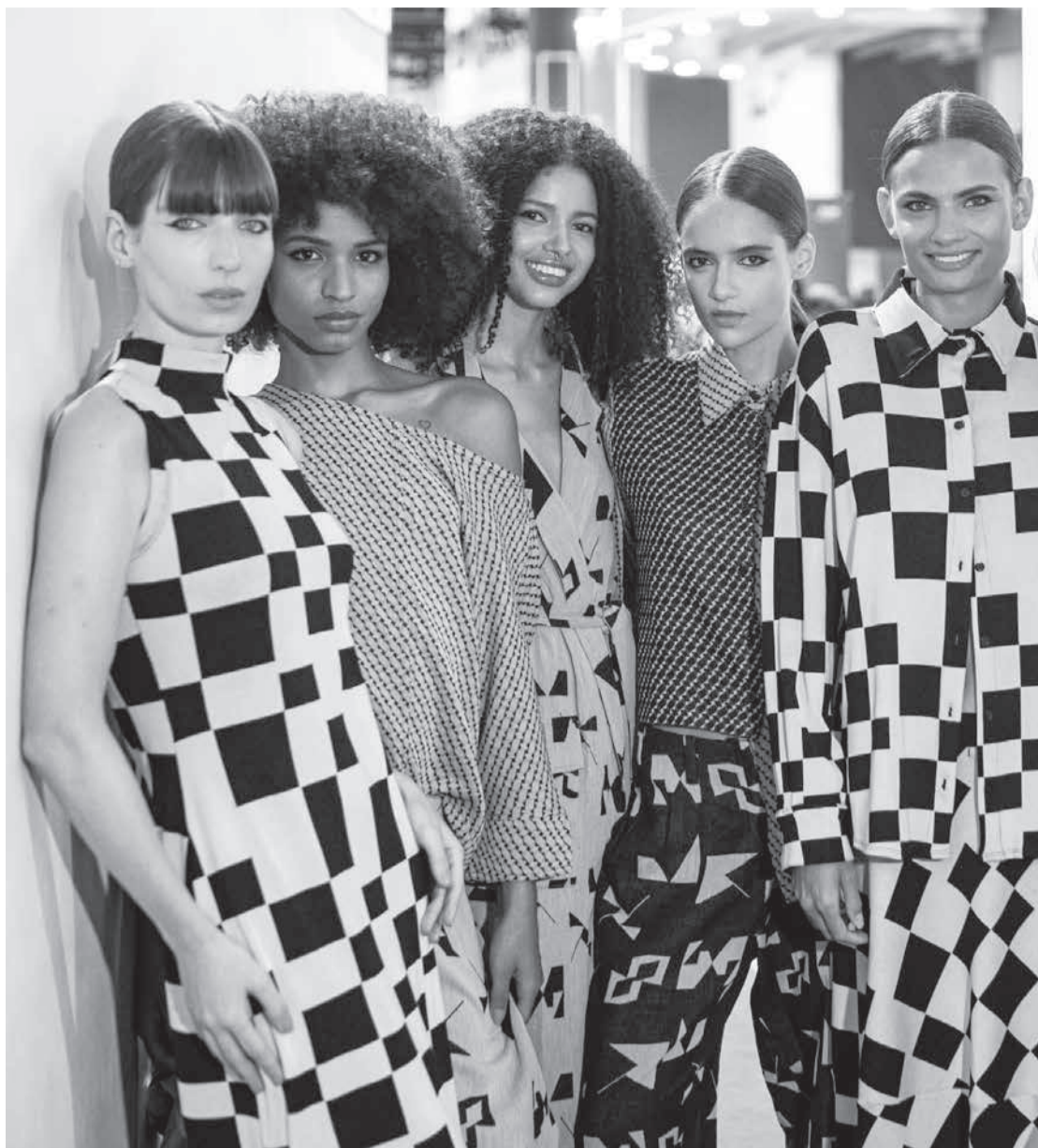
Moda mineira na feira WTM / SP