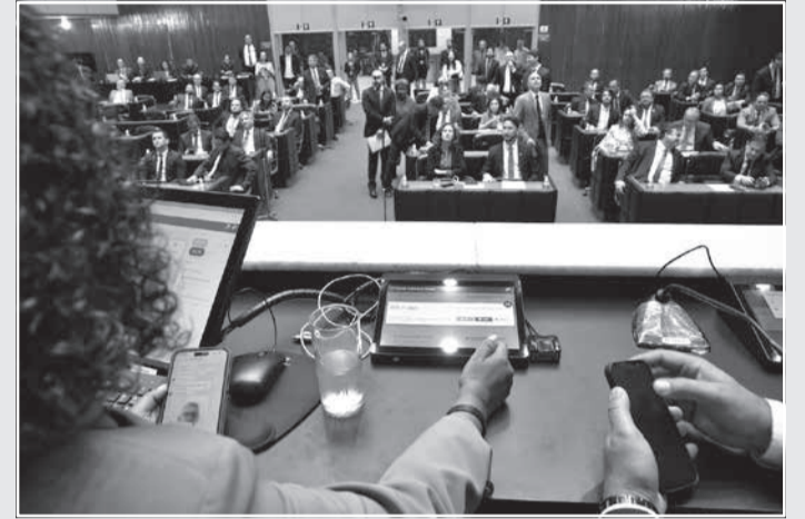
Parlamentares durante a votação de projetos na Reunião Ordinária de Plenário

Limitação para jetons - O substitutivo nº 1, apresentado depois de haver análise das emendas, limita a percepção de remuneração de qualquer natureza pela participação em apenas um conselho administrativo ou fiscal da administração direta ou indireta (os chamados jetons) a esse grupo de