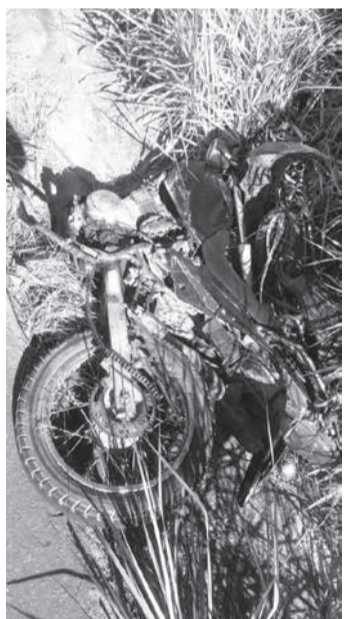
Motocicleta envolvida no acidente, na MG 217, entre Malacacheta e Água Boa

O acidente aconteceu na manhã de sexta-feira (07/04), na rodovia MG 217, km 117, em Água Boa. A Polícia Militar foi acionada, uma equipe foi ao local onde fez contato com o comandante da equipe do Corpo de Bombeiros responsável pelo atendimento, ele informou se tratar de uma colisão frontal envolvendo uma motocicleta e um caminhão, e os dois ocupantes