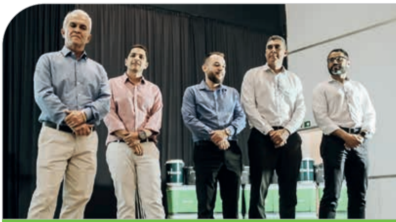
Conselheiros e diretores do Sicoob Credivale