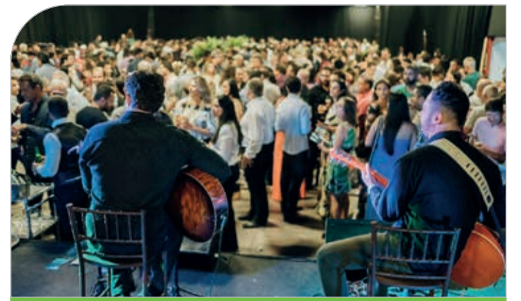
Evento encerrado com um coquetel ao som da Banda Tocaia