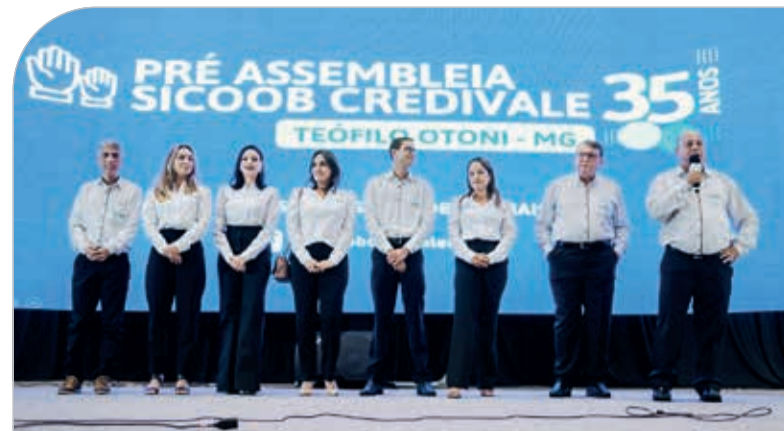
Gerentes das agências Sicoob Credivale de Teófilo Otoni