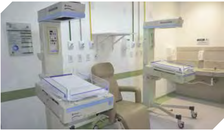
UTINP passa a contar com 180m², 9 leitos neonatais e 1 pediátrico