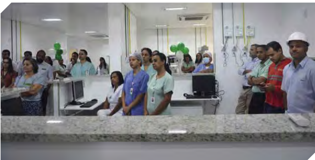
São 10 leitos de alta performance com equipe multidisciplinar composta por 30 profissionais

O Hospital Santa Rosália realizou solenidade, na terça-feira (09/05/23), para a inauguração da Unidade de Terapia Intensiva Neonatal (UTINP), totalmente reformada, instalada no 7º andar da Santa Casa, no prédio anexo – Rua Dr. Onofre. O setor passou por completa reformulação e ampliação, para proporcionar