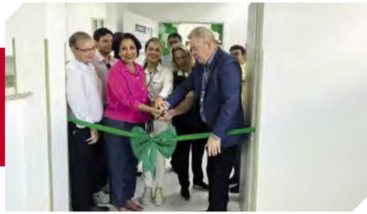
Corte da fita de inauguração da reforma e ampliação da UTINP do HSR