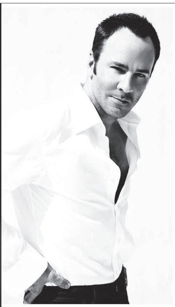
O criador e sua obra