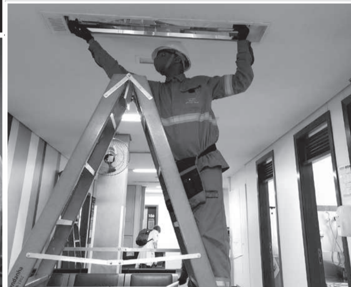
Centenas de instituições, como hospitais, escolas, órgãos públicos, iluminação pública, entre outros, receberam a substituição da iluminação