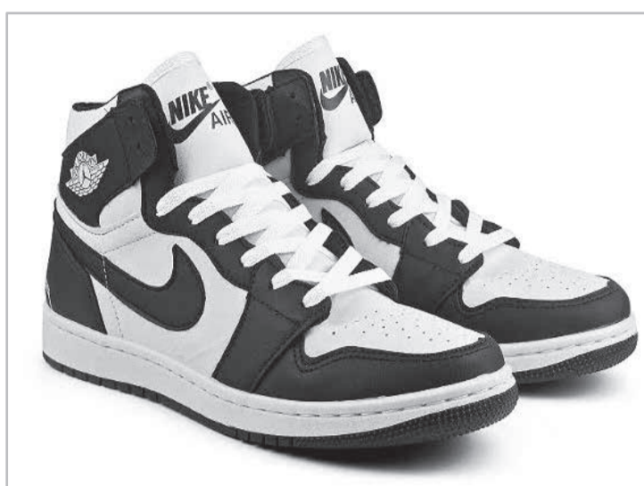
Tênis Air Jordan

Mas também há desacertos. É o caso da Adidas e do cantor americano Jay-Z (que passou a se chamar Yeezy), quando esse foi cancelado nas redes por ter feito declarações antisemitas. As vendas despencaram e a marca está com estoque encalhado de