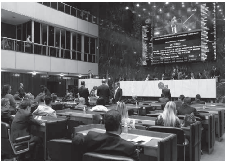
Diversos deputados subiram à tribuna pedindo a derrubada de parte do veto parcial do governador que impediria atendimento especial a pessoas com TEA

Votações em separado garantem programas e centros regionais de referência no atendimento a pessoas com Transtorno do Espectro do Autismo