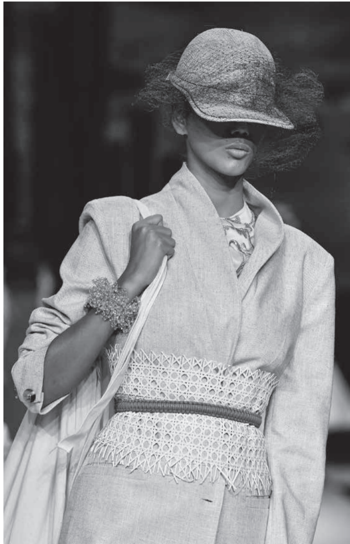
Desfile na Minas Trend

>As collabs (parcerias) entre grifes de moda e marcas que (aparentemente) nada tem a ver com a moda continuam acontecendo, para surpresa de todos. A mais recente é de uma grife com a Bauducco – que fabrica pães e chocolates. O ‘ponto de convergência’ ficou no marrom achocolatado das estampas e o marrom-cacau para todo lado. ***