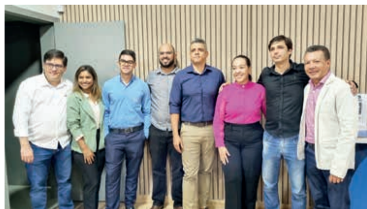
AAD Vales é uma iniciativa conjunta da ACE - Teófilo Otoni, CDL-TO e Sindcomércio, com o apoio de várias entidades e instituições