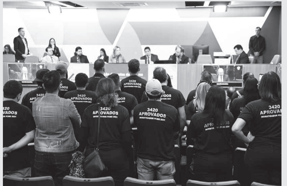
A chefe da Polícia Civil, Leticia Gamboge, foi ouvida na Comissão de Segurança Pública em atividade do 1º ciclo de reuniões de Prestação de Contas do Governo em 2023, iniciativa do Assembleia Fiscaliza

Solução para déficit de pessoal também foi cobrada em reunião de prestação de contas do Assembleia Fiscaliza