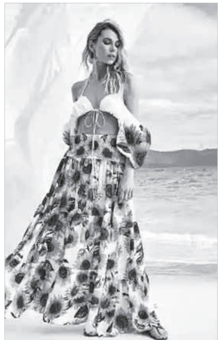
A moda de Eduardo Amarante

>Os lançamentos da moda masculina no circuito europeu, na segunda quinzena de junho, tiveram movimento e brilho bem acima do usual para o segmento. Tudo por conta do barulhento desfile que o novo estilista de