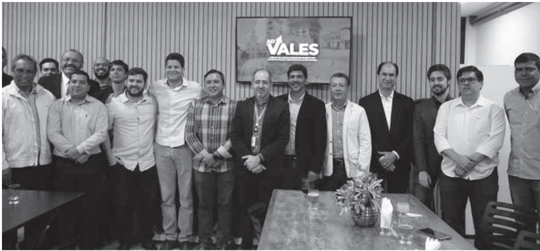
A Agência foi criada em 2009, pelo Sindcomércio, posteriormente integrada pela CDL, ACE, Sicoob Credivale, SPRTO e poder público municipal