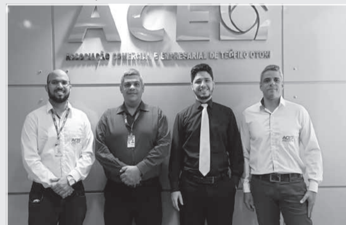
Entre as muitas conquistas da ACE no 1º semestre, destaca-se a parceria efetivada com a CAIXA, que dispõe de uma linha de crédito especial para os associados da ACE