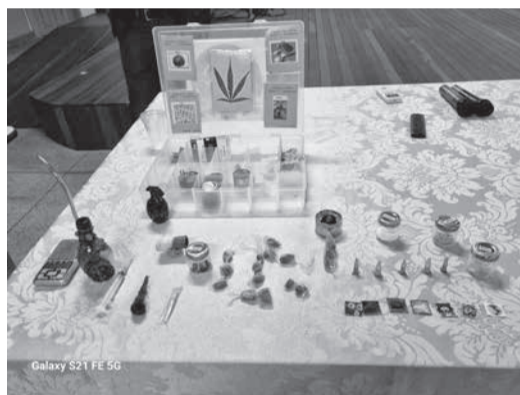
Galaxy S21 FE 5G