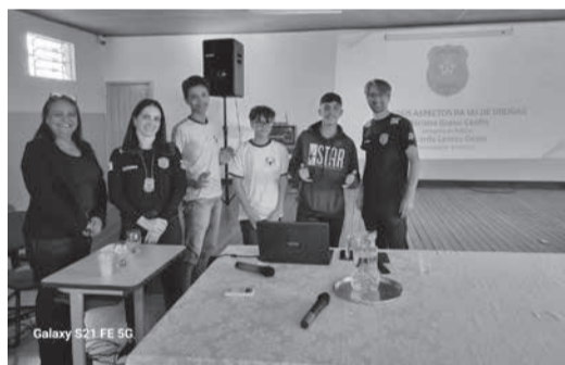
Galaxy S21 FE 5G

A Polícia Civil de Minas Gerais, por meio da Delegacia Adjunta de Tóxicos e Entorpecentes de Teófilo Otoni, atendendo a convite feito pela direção da Escola Estadual Alfredo Sá, em Teófilo Otoni, realizou na terça-feira (4/7/2023), no auditório da instituição de ensino, palestras sobre “Os