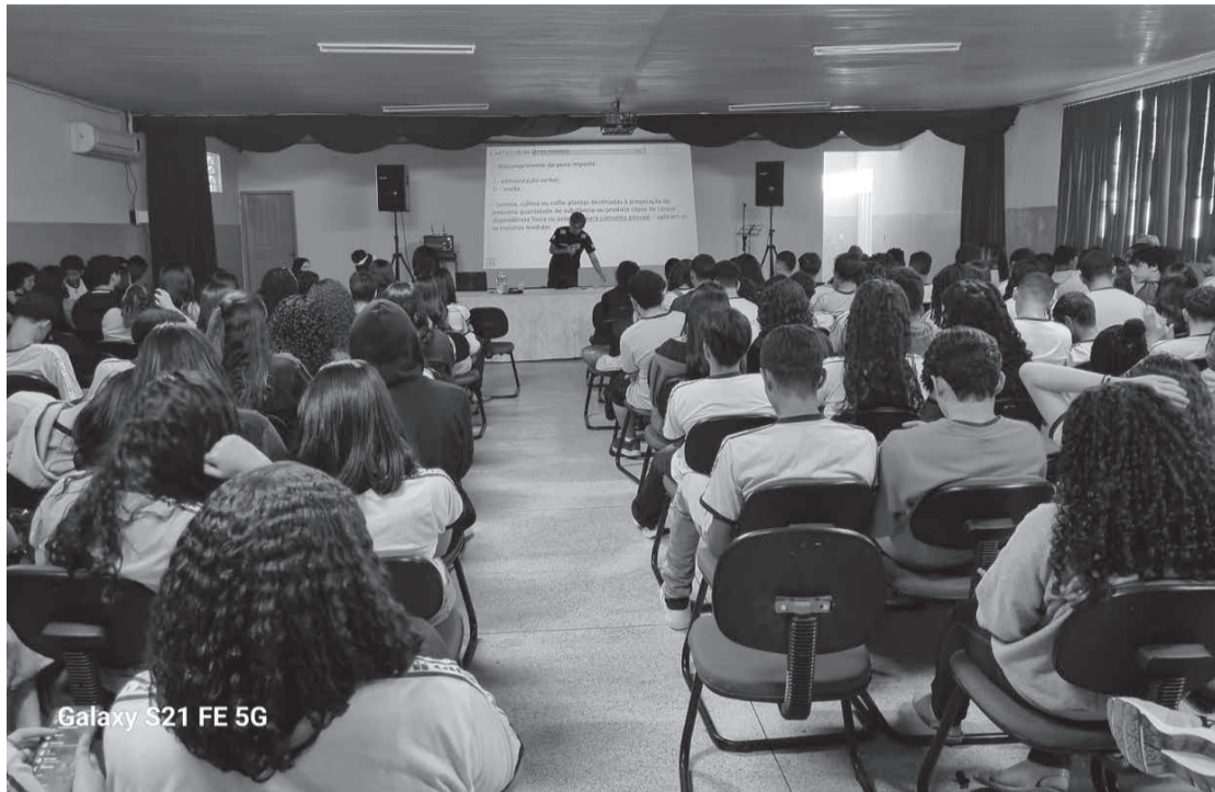
Galaxy S21 FE 5G