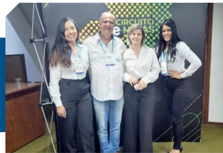
Durante o encontro foi abordado o importante papel do empreendedorismo feminino como alavanca de transformação social e de mudança