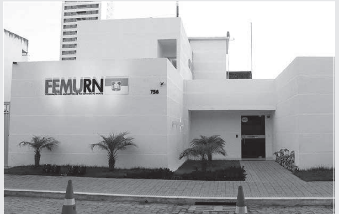
Sede da Federação dos Municípios do Rio Grande do Norte (FERMUN)

Volume aumentou 20% em relação ao mesmo período de 2022; pagamento seria dia 30, mas por ser domingo o repasse é antecipado