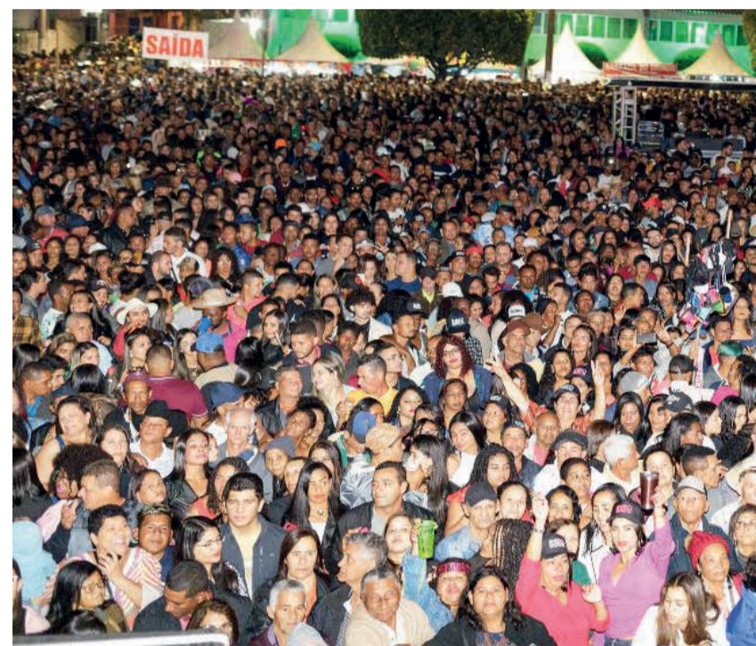
Uma multidão jamais vista nas festividades de Ladainha – quase 20 mil