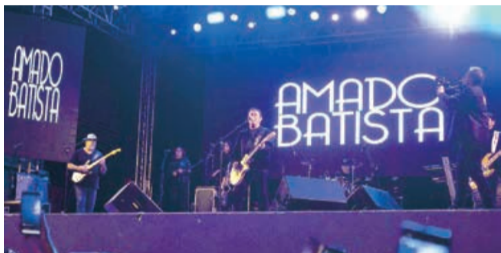
Show com Amado Batista foi a grande atração do evento, no sábado (29), com um público jamais visto na cidade

sideravelmente o comércio, com hotéis e pousadas lotados, restaurantes, bares, lojas diversas movimentadas, além dos empregos indiretos com barraquinhas, montagens de equipamentos e feiras artesanais. O prefeito agradeceu todos os