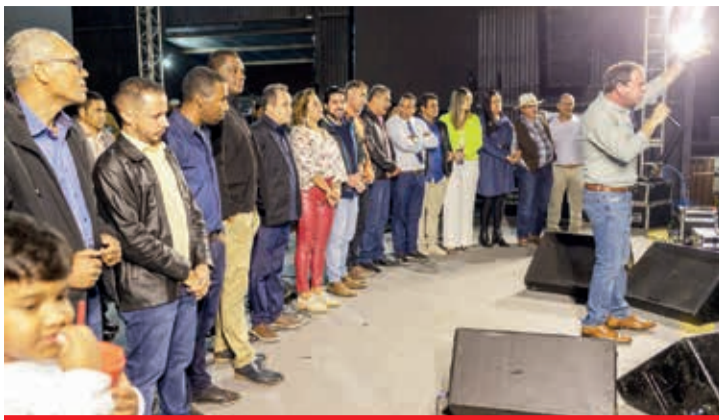
Prefeitos, vereadores e deputados prestigiaram o evento