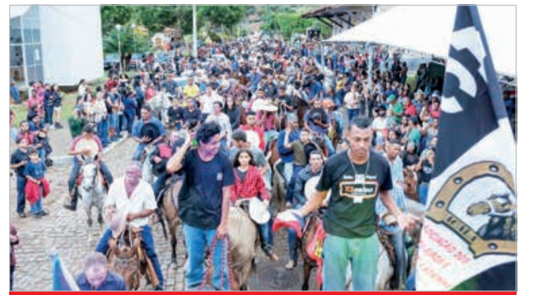
A tradicional Cavalgada foi realizada no domingo (23/7)