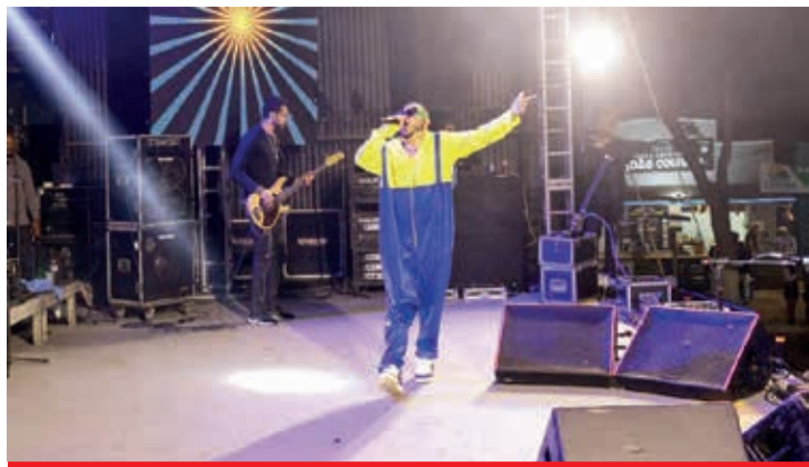
Show com Tomate, muito Swing e alegria em Ladainha