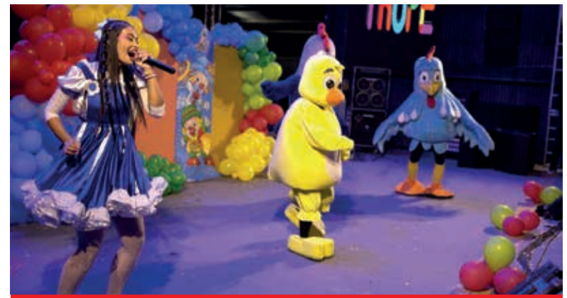
Show Cover Galinha Pintadinha alegrou a criançada