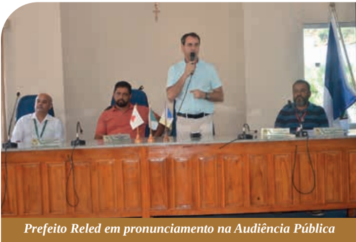
Prefeito Reled em pronunciamento na Audiência Pública