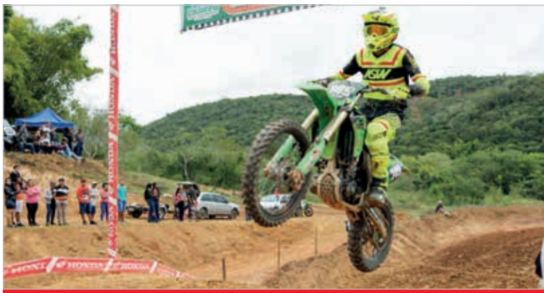
Motocross, muita adrenalina, um show de acrobacia nas alturas